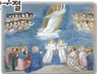
'그리스도의 승천', 지오토 디 본도네 작

예수님께서서는 그들을 베타니아 근처까지 데리고 나가신 다음, 손을 드시어 그들에게 강복하셨다. 이렇게 강복하시며 그들을 떠나 하늘로 올라가셨다(루카 24,50-51).