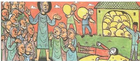
'어리석은 부자의 비유' 에기노 바이너트 작

'어리석은 자야, 오늘 밤에 네 목숨을 되찾아 갈 것이다. 그러면 네가 마련해 둔 것은 누구 차지가 되겠느냐?'(루카 12,20).