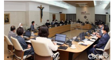
[보도자료 보기 - 이미지 클릭]