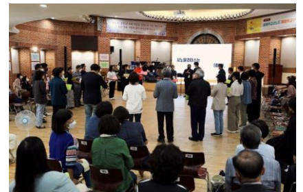
[세계주교시노드 의정부교구 경청 모임]