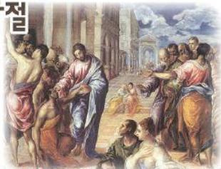
'소경의 눈을 뜨게 하는 예수님' 엘 그레코 작