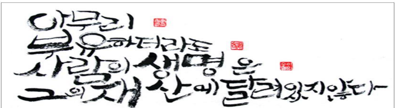
[ 서예가 이수현(베르나르도·69·성남대리구 도척본당)씨 작품. 루카복음 12 장 15 절 내용 ]