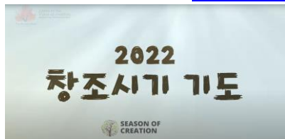
[창조시기 기도하기 - 이미지 클릭]

창조질서를 회복하고 보전하기 위해 노력하시는 프란치스코 교황님께서서는 ‘피조물 보호를 위한 기도일 날’인 9월 1일부터 ‘아시시의 성 프란치스코 기념일’인 10월 4일까지를 ‘창조 시기 - Season of Creation’로 정하시면서 모든 신자가 피조물 보호를 위해 기도할 것을 요청하셨습니다. 창조시기 안내서 링크: https://tinyurl.com/2uetrvm8