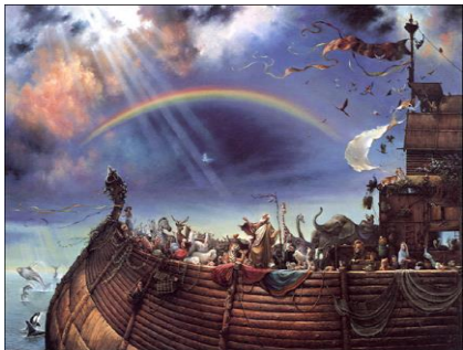
구약에서의 세례의 전표 (노아의 홍수 ↑ 와 출애굽 →)

세례성사는 교회의 다른 모든 성사를 받을 자격을 갖추게 하고, 교회 공동체의 일원으로서 권리와 의무를 수행할 수 있게 하는 가장 기본적이고 기초적인 성사이며, 성령 안에 거룩한 생활로 들어가는 문이라고 할 수 있다.