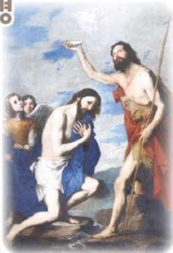
'그리스도의 세례' 호세 데 리베라 작

성령께서 비둘기 같은 형체로 그분 위에 내리시고, 하늘에서 소리가 들려왔다. "너는 내가 사랑하는 아들, 내 마음에 드는 아들이다"(루카 3,22)