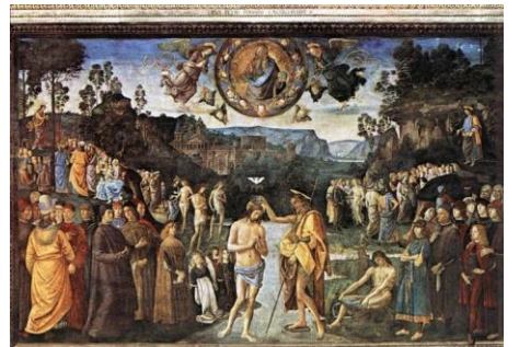
신약의 세례 (요한·예수·교회의 세례)