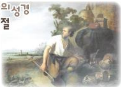
'밭에 숨겨진 보물의 비유', 렘브란트 작

하늘 나라는 밭에 숨겨진 보물과 같다. 그 보물을 발견한 사람은 그것을 다시 숨겨 두고서는 기뻐하며 돌아가서 가진 것을 다 팔아 그 밭을 산다(마태 13,44).