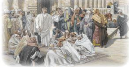
'예수님께 질문하는 바리사이들' 제임스 티소트 작

사람 밖에서 몸 안으로 들어가 그를 더럽힐 수 있는 것은 하나도 없다. 오히려 사람에게서 나오는 것이 그를 더럽힌다(마르 7,15).