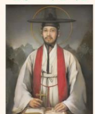
성 김대건 안드레아 신부님 탄생 200주년 회년

성 김대건 안드레아 신부님 일대기 도서 판매($16) 문의 : 각 소공동체장 또는 이민정 글라라